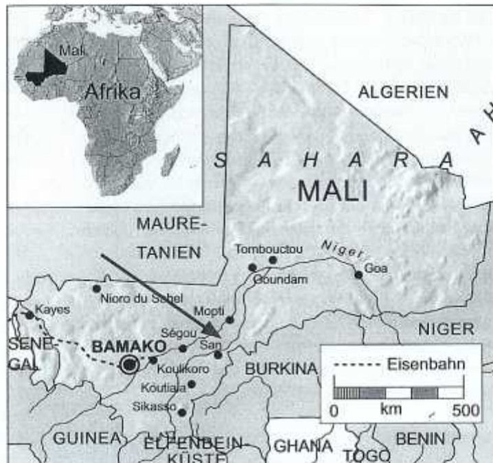
Hier leben Ihr Patenkind und seine Familie.

Projektname: Sanke ADP Projektart: Regional-Entwicklungsprojekt Projektnummer: MLI-170368 Land: Mali